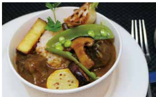
牛肉の 軟らか煮込みカレー (税込) ¥1296