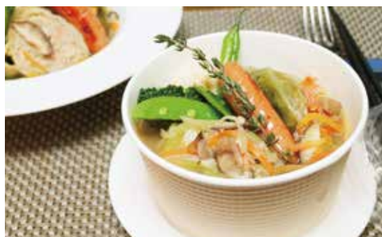
春キャベツの肉詰め 粗挽きソーセージ (税込) ¥1188