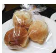
焼き立てパン2種 ¥200 (税込) ¥216