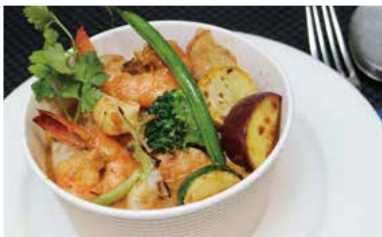
魚貝たちの オマール海老ソースカレー (税込) ¥1188