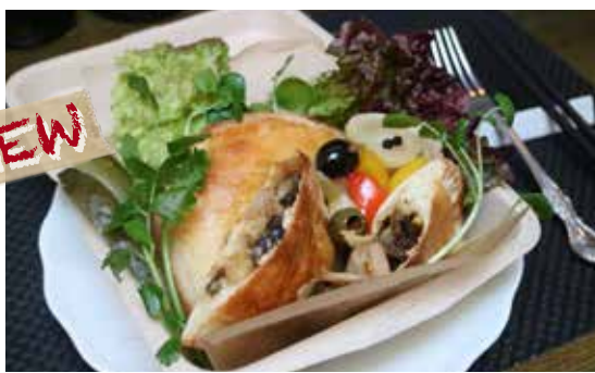
エスカルゴ・ロースハム・茸の カルツオーネ ピクルス添え (税込) ¥1080