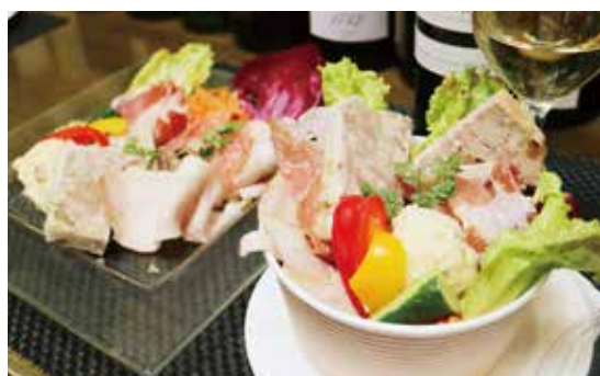
ドゥシェフのフレンチBOX ¥1100 鶏・豚2種のパテ / 自家製ロースハム / ポテトサラダ (税込) ¥1188