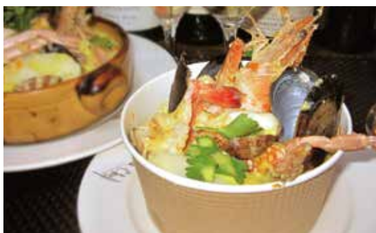
ドゥシェフの おすすめブイヤベース (税込) ¥1404